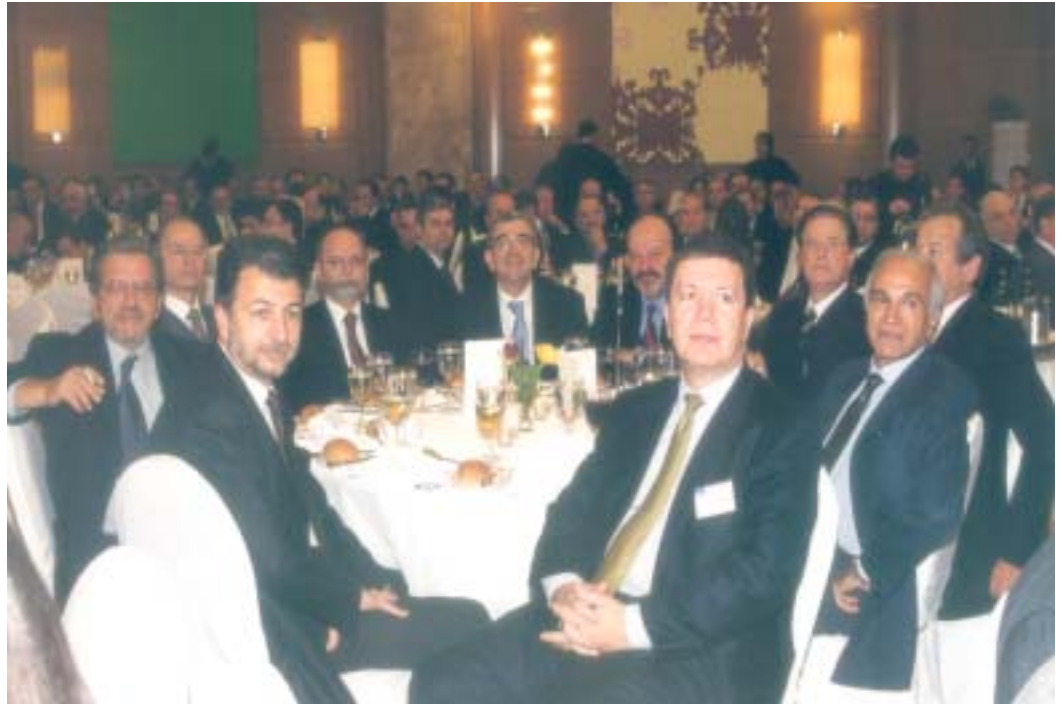
Το τραπέζι με τα στελέχη της Ελληνικά Πετρέλαια στο επίσημο δείπνο, στην διάρκεια των εργασιών του συνεδρίου του Ελληνοαμερικανικού επιμελητηρίου.

παραγωγής ηλεκτρισμού στην Ελλάδα που έχει κατασκευαστεί με τεχνολογία συνδυασμένου κύκλου και τροφοδοσία φυσικού αερίου. Πρόκειται για ένα εργοστάσιο με αεριοστρόβιλο 9FA της General Electric, δυναμικότητας 390 MW , το οποίο θα λειτουργεί από τη θυγατρική "Ενεργειακή Θεσσαλονίκης". Με την έναρξη της λειτουργίας του νέου εργοστασίου, στο αμέσως επόμενο διάστημα θα τροφοδοτείται το σύστημα